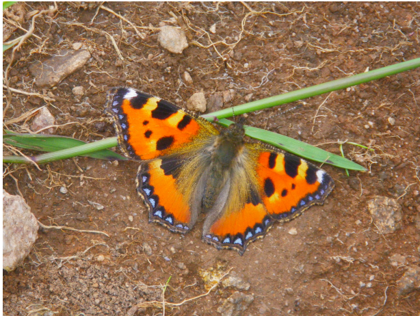
Kleiner Fuchs - Aglais urticae

Treffpunkt sowie Start+Ziel ist am WaldHaus (Samstag jeweils 30 Minuten vor Exkursionsbeginn!)