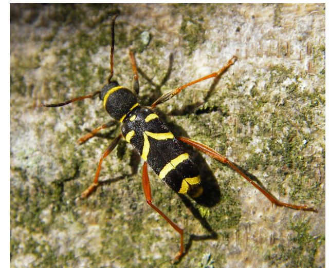
Echter Widderbock - Clytus arietis